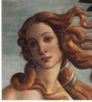
BOTTICELLI Venus from the Birth of Venus

No hi ha un focus de llum concret, però sí que podem rallar d'un cert joc amb els clars i foscos que dota les formes de volum i d'una suau llum daurada que banya tots els personatges, intensificant la bellesa ideal de tota la composició.