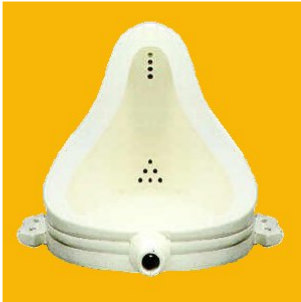
Marcel Duchamp, urinario