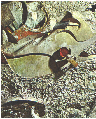
ejemplo de arquitectura de dadaísmo