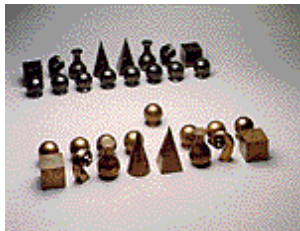
Man Ray, "Chess Set", 1926