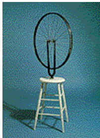
Marcel Duchamp "Bicycle Wheel", 1913