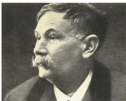
Benito Pérez Galdós:

Nació en 1843 en Las Palmas. Desde niño se interesaba por la pintura, los libros y la música. Cursó sus primeros años en la misma ciudad, pero sus padres decidieron que fuera, en 1862, a Madrid donde se licenció