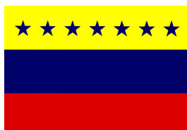
BANDERA DEL GOBIERNO FEDERAL